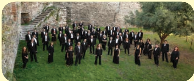
Κρατική Ορχήστρα Θεσσαλονίκης